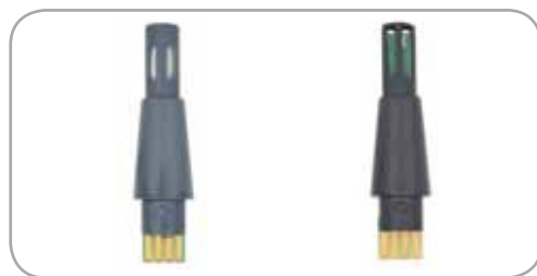
Sonde Hygrostick, référence POL4750, pour les applications fortement exposées à l'humidité.