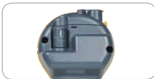
Sonde Quikstick ST POL78751, standard avec tous les kits MMS2 et dotées des mêmes performances que la sonde Quikstick standard. Une sonde Quikstick ST peut rester connectée au MMS 2 tout en utilisant les broches.

Il est possible de relever et de consigner facilement les valeurs de plusieurs sondes Hygrostick. Les valeurs de l'humidité peuvent être relevées en utilisant des manchons d'humidité ou un caisson d'humidité. Il convient d'utiliser des sondes Hygrostick, et non pas Humistick, pour cet essai.