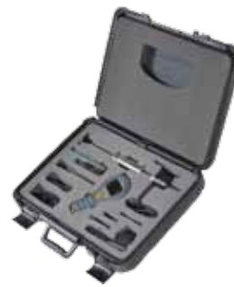
Kit de pochette de transport rigide MMS2